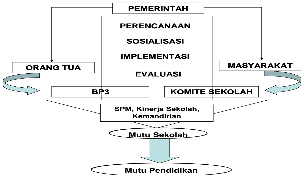
Gambar Kerangka Pikir Penelitian