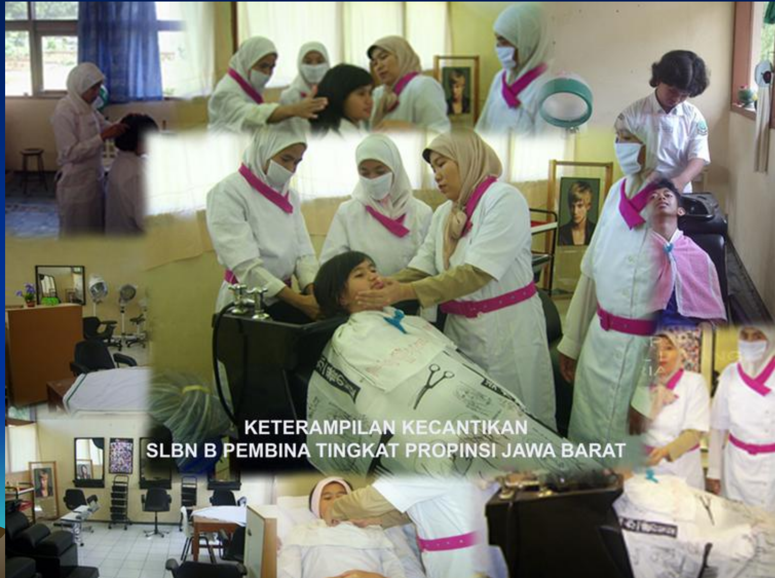
KETERAMPILAN KECANTIKAN SLBN B PEMBINA TINGKAT PROPINSI JAWA BARAT