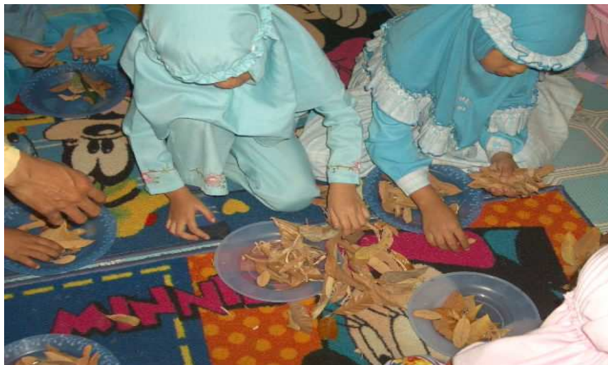
Gambar 4.4 Anak-anak menghitung jumlah dan mengelompokkan bentuk daun-daun