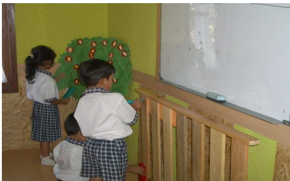
Gambar 4.6 Anak-anak mengukur benda yang ada di ruangan menggunakan balok