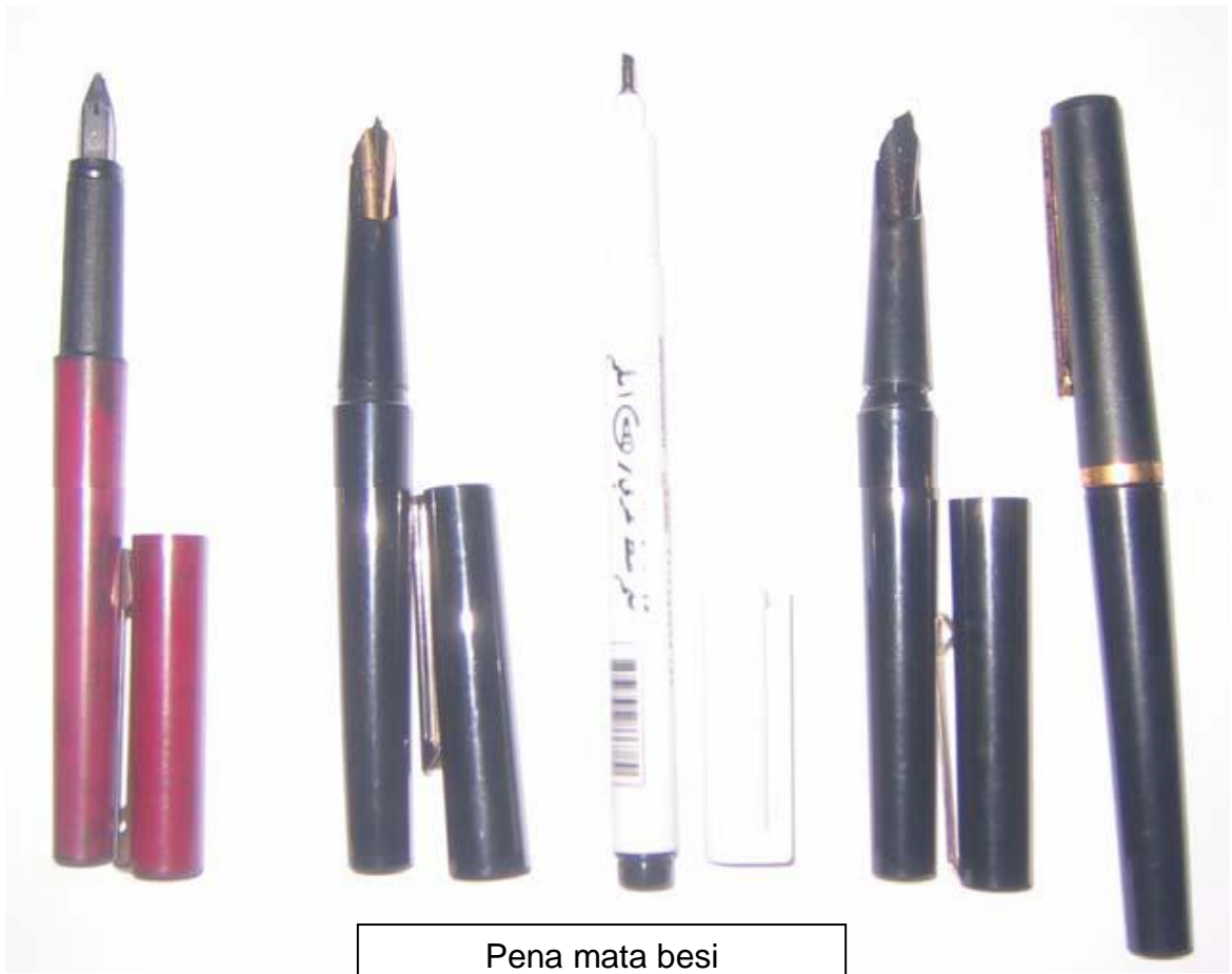
Pena mata besi

Kertas, buku latihan dan alas menulis. Sebaiknya gunakan kertas yang agak tebal, licin dan memudahkan pengeringan tinta. Kertas yang biasa digunakan ialah Art Paper, Mattart, Tracing Paper atau kertas biasa (seperti A4) 80 GSM ke atas yang licin serta tidak mudah mengembungkan tinta. Alas tulis digunakan sebagai penghalang kekasaran pada permukaan meja. Alas yang digunakan mempunyai garis/grid seperti contoh di bawah.