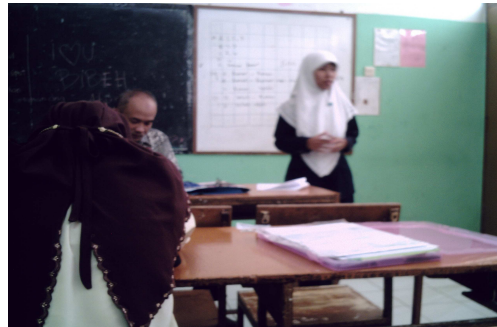
Gambar: Kegiatan briefing sebelum proses pembelajaran.

study dari UPI yang bertindak sebagai pemimpin briefing menjelaskan Lesson study secara singkat kepada seluruh observer yang hadir. Kemudian guru/dosen model diberi kesempatan untuk menyampaikan rancangan kegiatan yang akan dilaksanakan selama proses belajar mengajar di dalam kelas berlangsung.