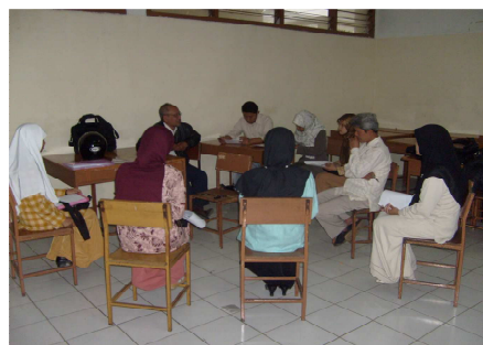
Gambar: Kegiatan refleksi yang diikuti oleh semua observer.

Para observer umumnya menyatakan salutnya kepada guru/dosen model sebagai model yang langsung dilihat oleh guru/dosen dan dosennya mengajar tanpa rasa gugup, bahkan suasana kelas pun komunikatif dan mahasiswa sepertinya tidak merasa terganggu aktivitasnya walaupun dilihat oleh beberapa observer/orang lain selain guru/dosen biasa mengajar. Di antara observer ada yang memberi masukan agar media pembelajarannya ditulis dengan huruf Arab yang agak besar agak terlihat oleh mahasiswa di belakang. Gambar berikut suasana refleksi.