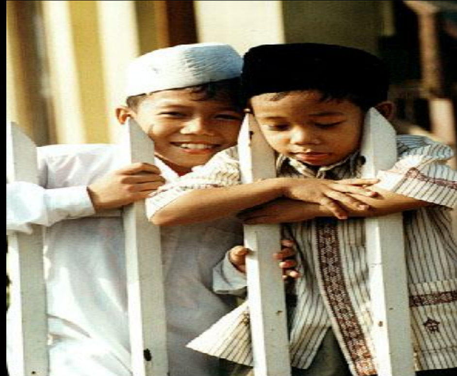
Young boys, Jakarta