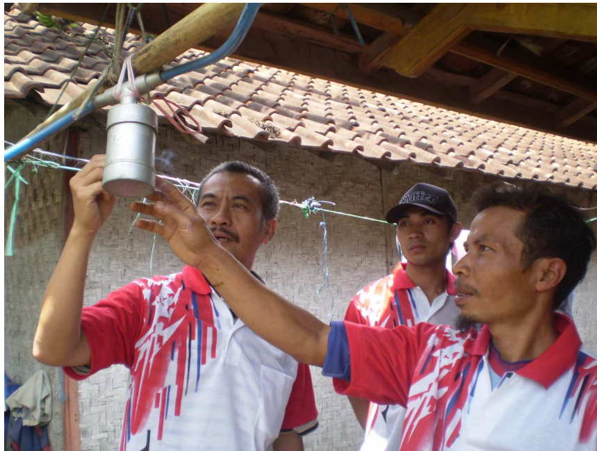
Gambar 9 Klep Pengaman Gas Sebelum Masuk ke Tabung Penampung Gas