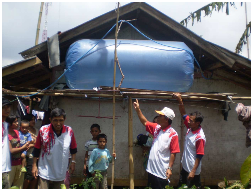
Gambar 7 Penampung Biogas sudah Terlihat Mengembung dan Mengeras