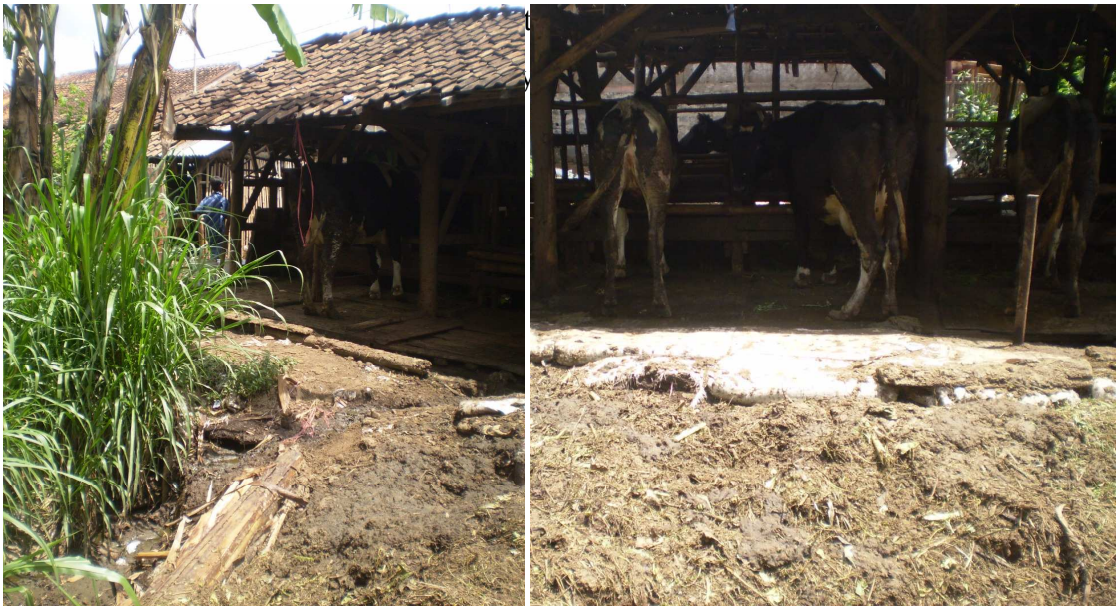
Gambar 11 Kondisi Kotoran Ternak yang Mencemari Lingkungan

Penggunaan kotoran ternak sebagai bahan masukan pembuatan biogas tidak serta merta didukung sepenuhnya oleh masyarakat di Kampung Parabon. Hal ini disebabkan oleh budaya masyarakat yang cenderung malas untuk mengumpulkan kotoran ternak. Bahkan seringkali kotoran ternak dibuang begitu saja dan