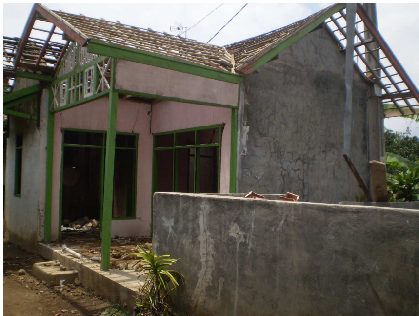
Gambar 10 Keadaan Rumah Penduduk di Kampung Parabon Pasca Gempa Bumi

Bencana gempa bumi di Jawa Barat yang terjadi pada tanggal 02 September 2009 mengakibatkan wilayah Kecamatan Pangalengan mengalami kerusakan secara fisik dan banyak memakan korban jiwa, tidak terkecuali Kampung Parabon. Banyak penduduk di Kampung Parabon yang masih mengalami trauma mendalam akibat bencana ini, sehingga kegiatan pengabdian ini sempat tertunda pelaksanaannya.