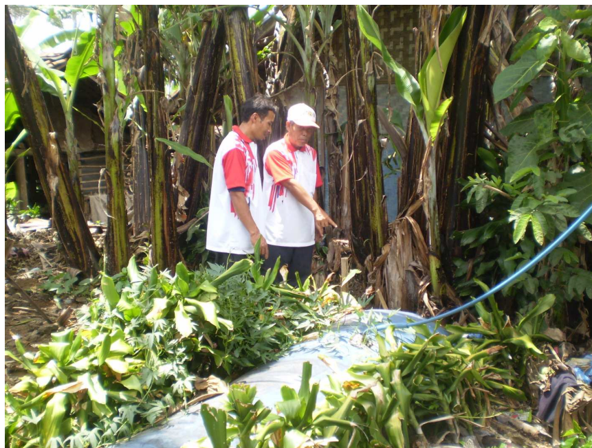
Gambar 5 Instalasi Reaktor Biogas