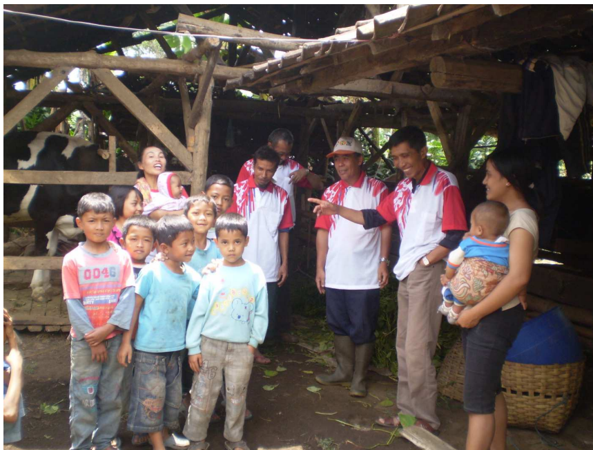
Gambar 2 Penyampaian Materi kepada Para Kader di Kampung Parabon

Khalayak sasaran yang strategis dalam kegiatan ini adalah para kader di kampung Parabon. Materi tentang peranan dan cara pembuatan biogas disampaikan kepada 10 orang kader di Kampung Parabon. Setelah program sosialisasi dan pelatihan pemanfaatan biogas skala rumah tangga dilaksanakan, para kader ini bertugas untuk membina dan meneruskan pendampingan kepada seluruh masyarakat di kampung Parabon.