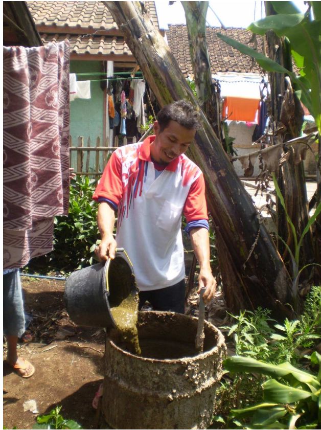
Gambar 6 Proses Pencampuran Kotoran Ternak dan Air