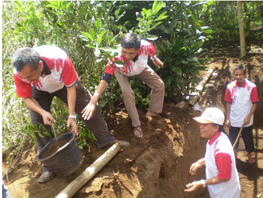
Gambar 4 Pembuatan Lubang Reaktor