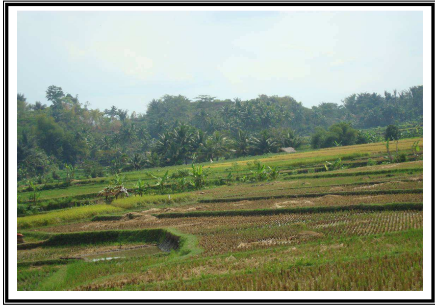
Gambar.4. Foto Bukit-bukit hasil Longsoran vulkanik (hillock) di sekitar Kota Tasikmalaya