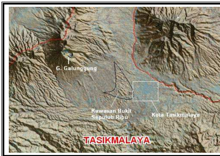
Gambar .2. Foto satelit Perbukitan Sepuluh Ribu, Gunung Galunggung Tasikmalaya dan Sekitarnya. (google)