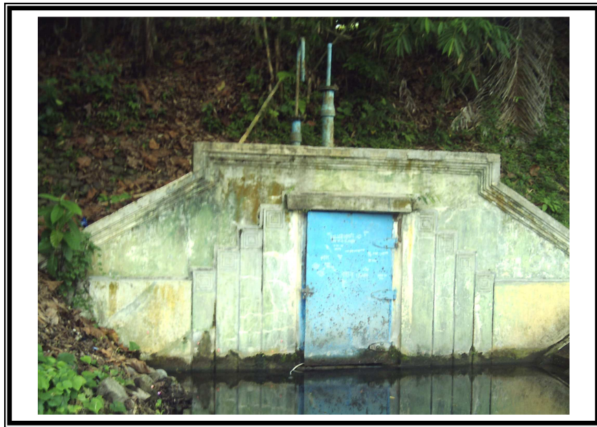
Gambar.5. Foto potensi Mata Air Cibunigeulis Indihyang sumber air PDAM Kota Tasikmalaya