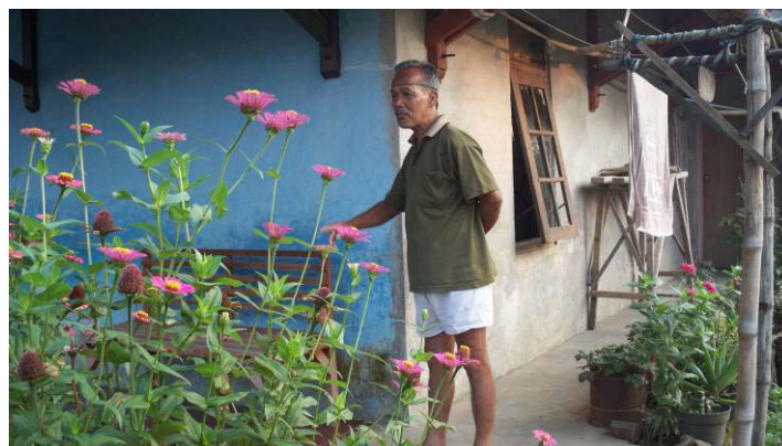
Gambar 7. Tinggi Muka Air Banjir di Pemukiman Penduduk

Banjir pada daerah kajian setiap tahun terjadi. Banjir terjadi karena luapan Sungai Cisangkuy dan akibat backwater dari mulai muara Sungai Cisangkuy di Sungai Citarum. Jarak muara ke lokasi kajian sekitar 1 km. Luapan Sungai Cisangkuy ini mengakibatkan genangan banjir setinggi 1 – 2 meter di pemukiman penduduk selama 1 – 2 hari (Gambar 7).