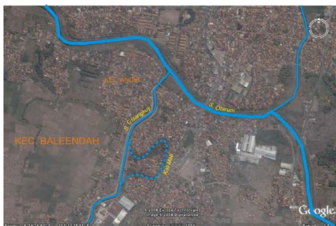
Gambar 3 Sungai Mati Akibat Penyudetan Sungai