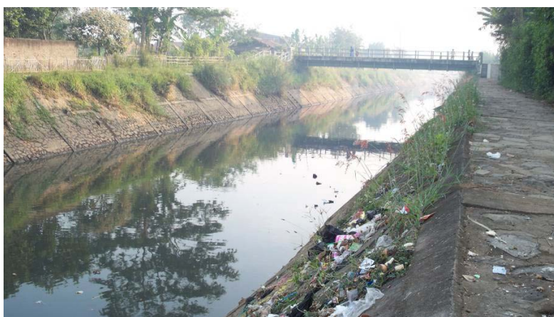
Gambar 4 Sungai Cisangkuy Baru