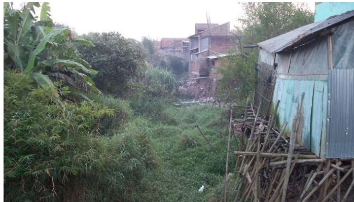
Gambar 8 Kondisi Ekologis di Sungai Mati