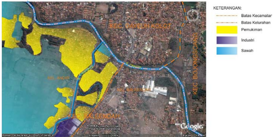
Gambar 5. Kondisi Penggunaan Lahan Sekitar Sungai Mati