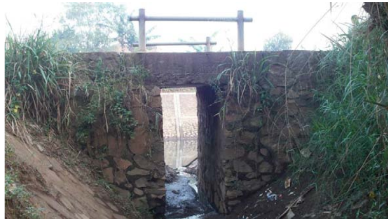
Gambar 6 Gorong-gorong Menghubungkan Sungai Mati ke Sungai Cisangkuy Baru

Banjir pada daerah kajian setiap tahun terjadi. Banjir terjadi karena luapan Sungai Cisangkuy dan akibat backwater dari mulai muara Sungai Cisangkuy di Sungai Citarum. Jarak muara ke lokasi kajian sekitar 1 km. Luapan Sungai Cisangkuy ini mengakibatkan genangan banjir setinggi 1 – 2 meter di pemukiman penduduk selama 1 – 2 hari (Gambar 7).