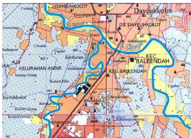
Gambar 2 Alur Sungai Cisangkuy Sebelum dilakukan Sudetan