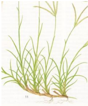
Stolon di bawah permukaan tanah