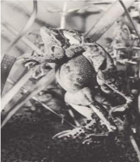
Gb 3.5 fertilisasi eksternal (katak)

Beberapa spesies seperti ikan, dan katak melakukan fertilisasi eksternal . Sel telur dilepaskan oleh betina dan dibuahi oleh jantan dalam lingkungan sekitarnya. Cara ini umumnya terjadi pada hewan air misalnya ikan atau amfibi