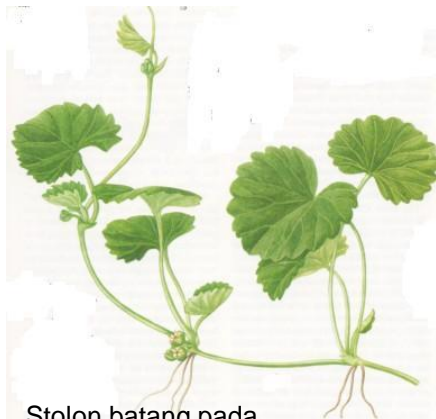
Stolon batang pada tanaman pegagan