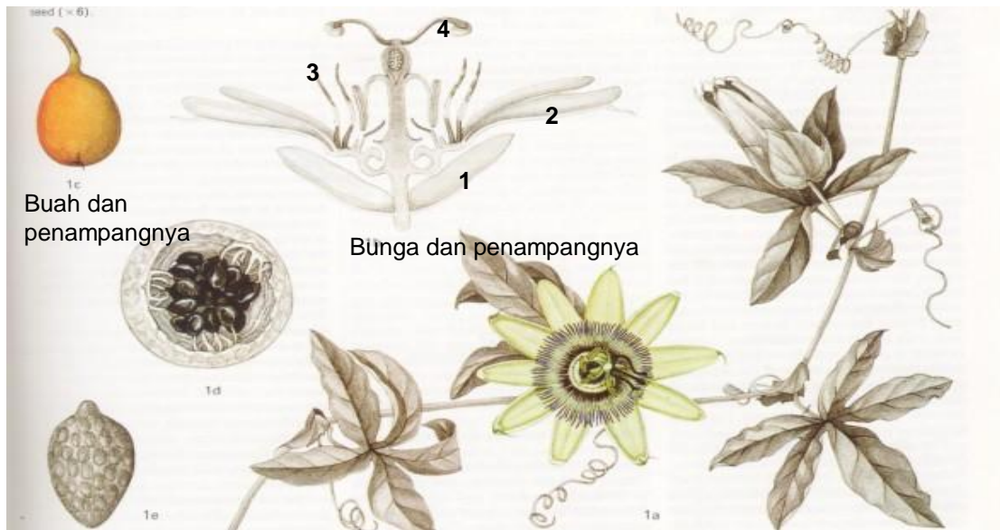
Gb. 3.1. Bunga dan penampang bunga pada tumbuhan berbiji tertutup Angiospermae beserta buah dan penampang buahnya Contoh tanaman markisa ( Pasiflora ). Keterangan nomor dapat dibaca dalam penjelasan . (Sumber: Heywood, 1993)

Bunga terdiri atas bagian-bagian (lihat Gambar 3.1.)