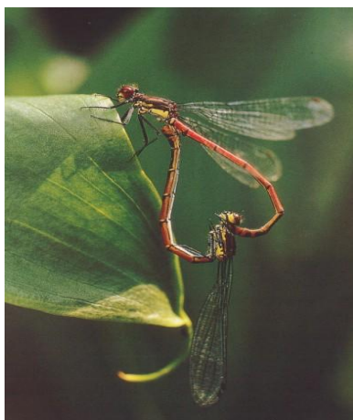
Gb. 3.4 pembiakan kawin pada capung, fertilisasi internal

Bagaimanakah alat reproduksi pada hewan? Dalam Bab II telah dijelaskan tentang cara reproduksi aseksual dan reproduksi seksual. Kini kita fokuskan pada reproduksi seksual. Pembuahan adalah proses peleburan sel sperma dengan sel telur. Pada serangga misalnya capung, melakukan fertilisasi internal