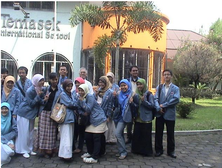
Kunjungan ke Temasek Int.Sch