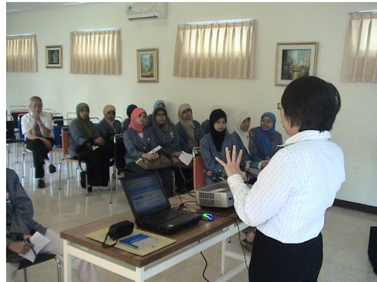
Kunjungan ke Temasek Int.Sch