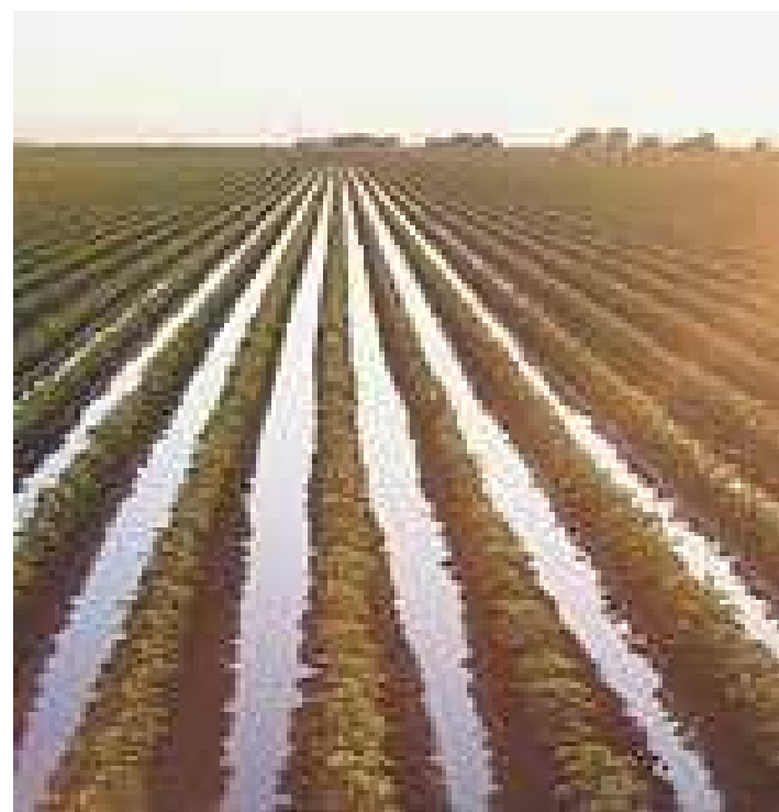
Pengaturan sistem perairan