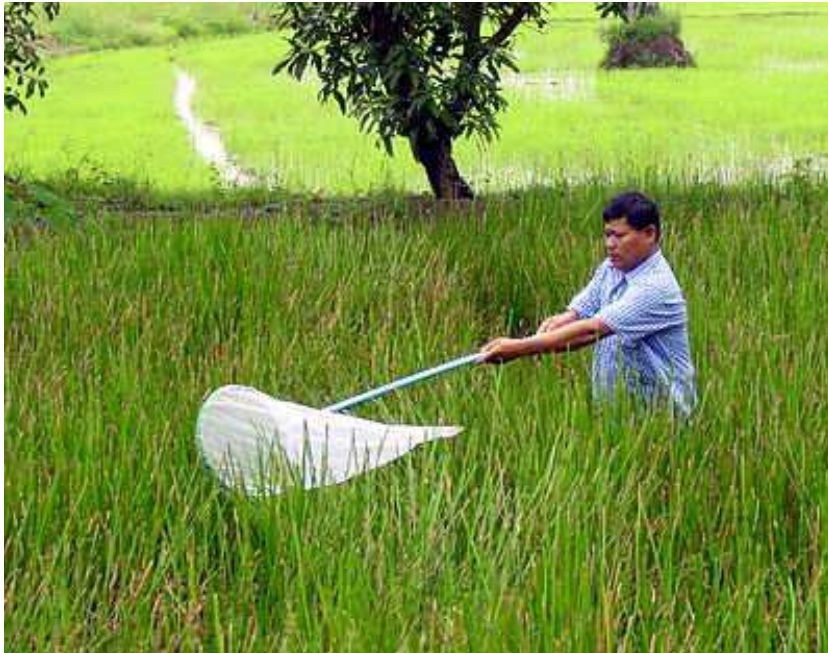
Insect Net/Sweeping Net