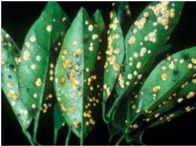
Daun yang diserang Aschersonia spp