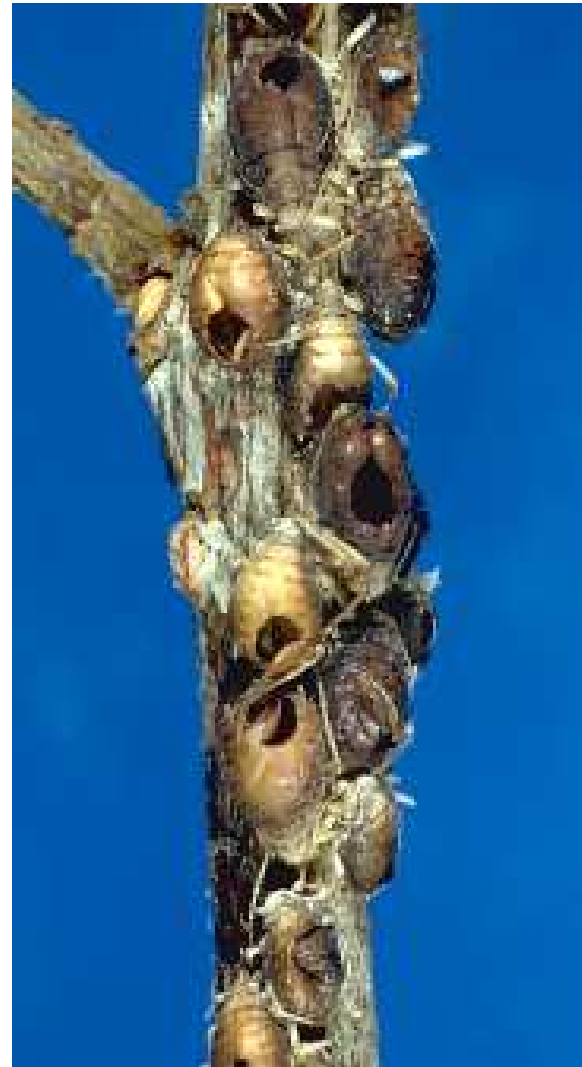
Aphid mummies with braconid emergence holes