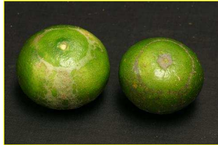
Buah jeruk yang diserang Thrips