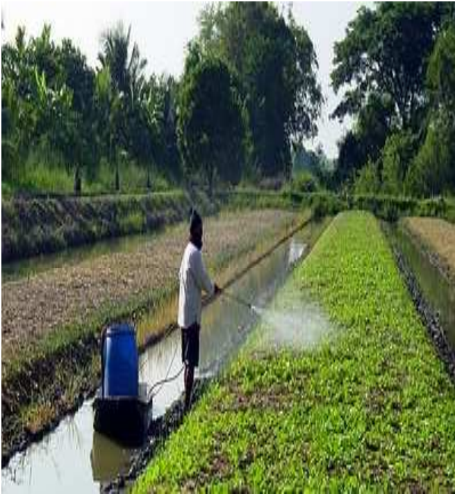
Pengaturan pemupukan dan Pemberian pestisida