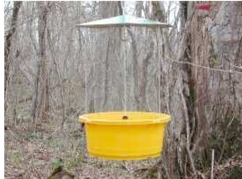
Perangkap dengan umpan