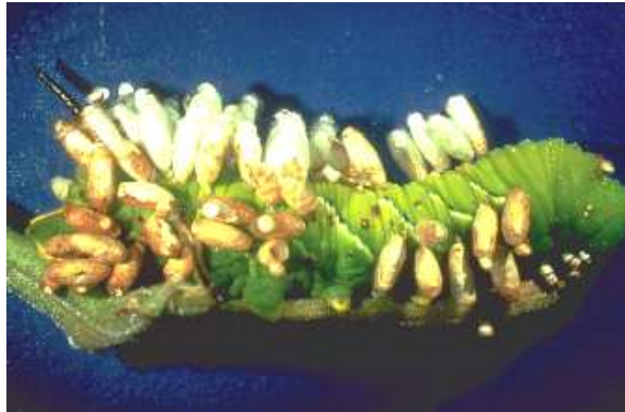
Cotesia congregata cocoons on tomato hornworm