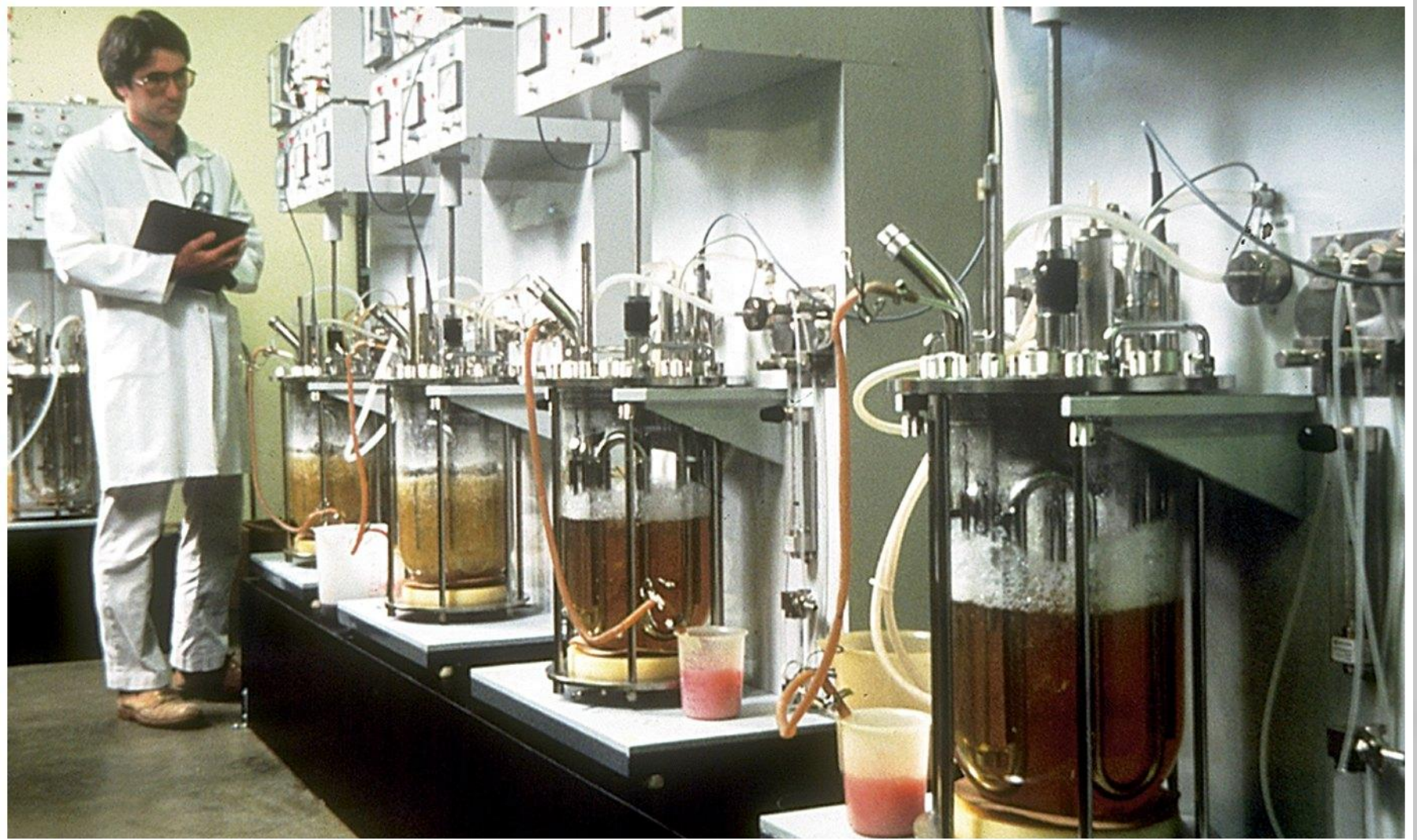
Figure 26-13b Microbiology, 6/e