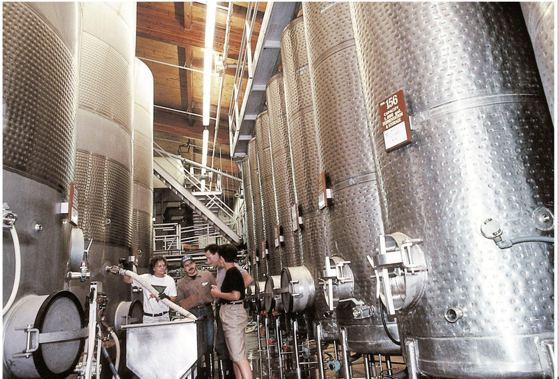
Figure 26-12b Microbiology, 6/e