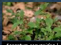
Ageratum conyzoides L.