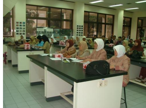
Kegiatan guru pada saat peer teaching