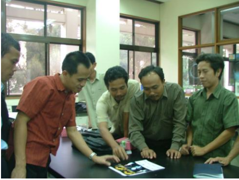
Kegiatan guru pada saat plan