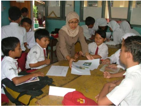
Kegiatan open lesson