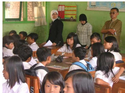
Kegiatan Open Lesson di SD N Rahayu 5