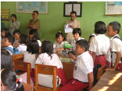
Kegiatan Open lesson di SD N Rahayu 3