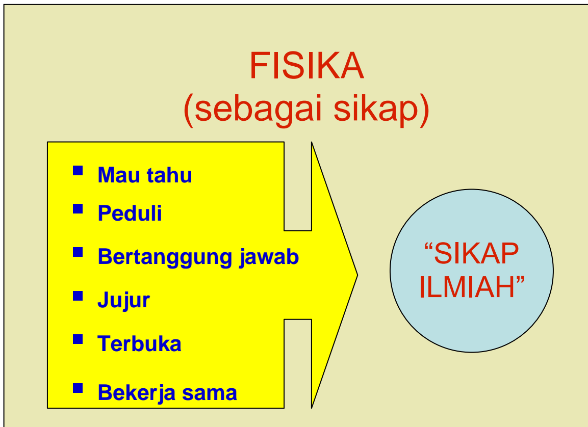
Gambar 4. Fsiika sebagai sikap.

kegiatan-kegiatan kreatif seperti pengamatan, pengukuran dan penyelidikan atau percobaan, yang kesemuanya itu memerlukan proses mental dan sikap yang berasal dan pemikiran. Jadi dengan pemikirannya orang bertindak dan bersikap, sehingga akhirnya dapat melakukan kegiatan-kegiatan ilmiah itu. Pemikiran-pemikiran para ilmuwan yang bergerak dalam bidang fisika itu menggambarkan, rasa ingin tahu dan rasa penasaran mereka yang besar, diiringi dengan rasa percaya, sikap objektif, jujur dan terbuka serta mau mendengarkan pendapat orang lain. Sikap-sikap itulan yang kemudian memaknai hakekat fisika sebagai sikap atau “ a way of thinking ”. Oleh para ahli psikologi kognitif, pekerjaan dan pemikiran para ilmuwan IPA termasuk fisika di dalmnya, dipandang sebagai kegiatan kreatif, karena ide-ide dan penjelasan-penjelasan dari suatu gejala alam disusun dalam fikiran. Oleh sebab itu, pemikiran dan argumentasi para ilmuwan dalam bekerja menjadi rambu-rambu penting dalam kaitannya dengan hakekat fisika sebagai sikap.