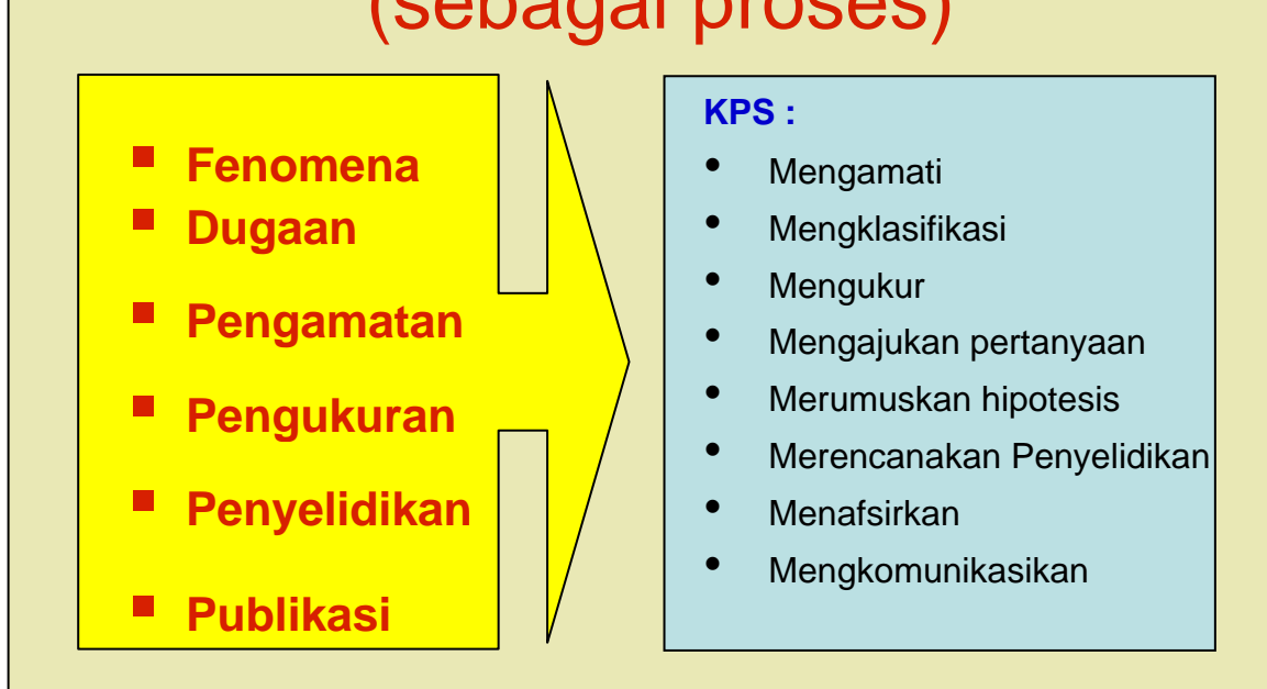
Gambar 3. Fisika sebagai proses.

Indikator dari setiap keterampilan proses pada gambar 3 di atas, adalah seperti yang tercantum dalam table 1 di bawah ini.