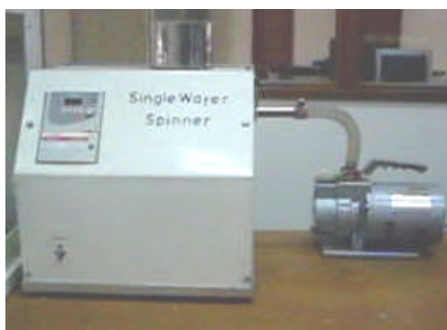
Gambar 1. Sistem alat spin-coating

Metode yang digunakan untuk penumbuhan film tipis GaN adalah metode sol-gel menggunakan teknik spin-coating dengan sistem alat seperti pada Gambar 1. Penumbuhan film tipis GaN dilakukan di Laboratorium Fisika Material, Jurusan Pendidikan Fisika, Fakultas Pendidikan Matematika dan Ilmu Pengetahuan Alam, Universitas Pendidikan Indonesia.