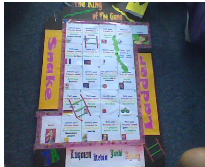
Gambar 1. Gambar Snake and Ladder

harus dilakukan oleh pemain (siswa). Kotak perintah sudah dimodifikasi agar siswa mendeskripsikan sesuatu benda, orang, tempat atau kegiatan.