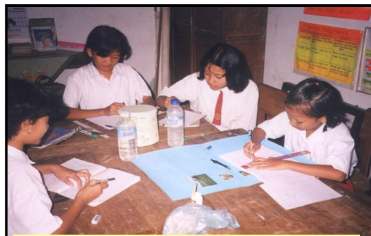
Pada saat pembelajaran perhatian harus kepada kegiatan siswa. Anak ini aktif dan senang belajar

(Fasilitator hendaknya mengingatkan bahwa dalam mengamati, pertanyaan pokok yang menjadi pegangan adalah "Sejauhmana PEMBELAJARAN memenuhi karakteristik PAKEM?" Ingatkan kelompok agar setelah berpraktik membawa hasil kerja siswa untuk bahan kajian di tempat pelatihan).