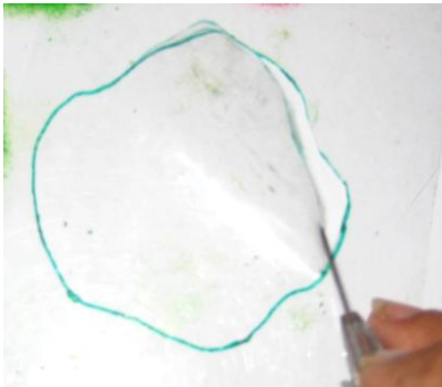
Proses Membuat Acuan Cetak

Setelah membuat desain, peserta membuat acuan cetak yang terbuat dari plastik jilid.