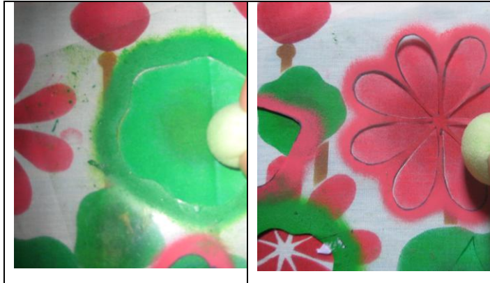
Pemberian Warna pada Acuan Cetak

Peserta membubuhkan warna di atas kain. Warna yang dibubuhkan harus melalui acuan cetak.