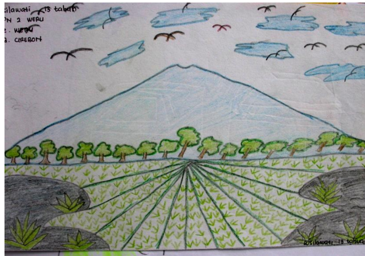
Gambar 11 Gambar anak yang bertipe visual