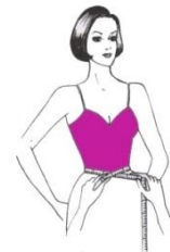
Gambar 2 Mengukur Lingkar Pinggang

Diukur sekeliling pinggang pas, kemudian ditambah 1 cm, atau diselakan 1 jari.