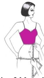
Gambar 3 Mengukur Lingkar Panggul dan Tinggi Panggul

Diukur sekeliling panggul yang terbesar, diukur pas dulu kemudian ditambah 4 cm atau diselakan 4 jari.