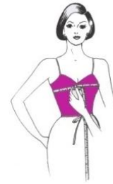
Gambar 1 Mengukur Lingkar Badan

Diukur sekeliling badan atas yang terbesar, melalui puncak dada dan ketiak. Letak pita ukuran pada badan belakang harus datar dari ketiak. Diukur pas dulu kemudian ditambah 4 cm atau diselakan 4 jari