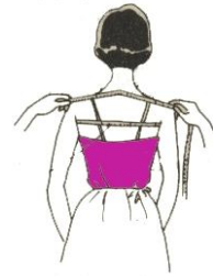
Gambar 5 Mengukur Panjang Bahu

Diukur dari batas leher ke puncak lengan, atau puncak bahu yang terendah.