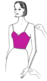
Gambar 9 Mengukur Panjang Lengan

Lengan panjang diukur dari puncak lengan sampai melebihi tulang pergelangan lengan yang menonjol, sedangkan lengan pendek diukur dari puncak lengan sampai panjang lengan pendek yang dikehendaki.