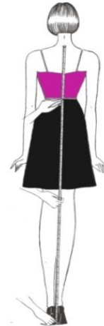
Gambar 6 Mengukur Panjang Blus dan Rok

Mengukur panjang blus bisa dari batas pinggang ke bawah sampai panjang yang diinginkan atau bisa juga dari ujung bahu atas tegak lurus ke bawah sampai panjang yang diinginkan.