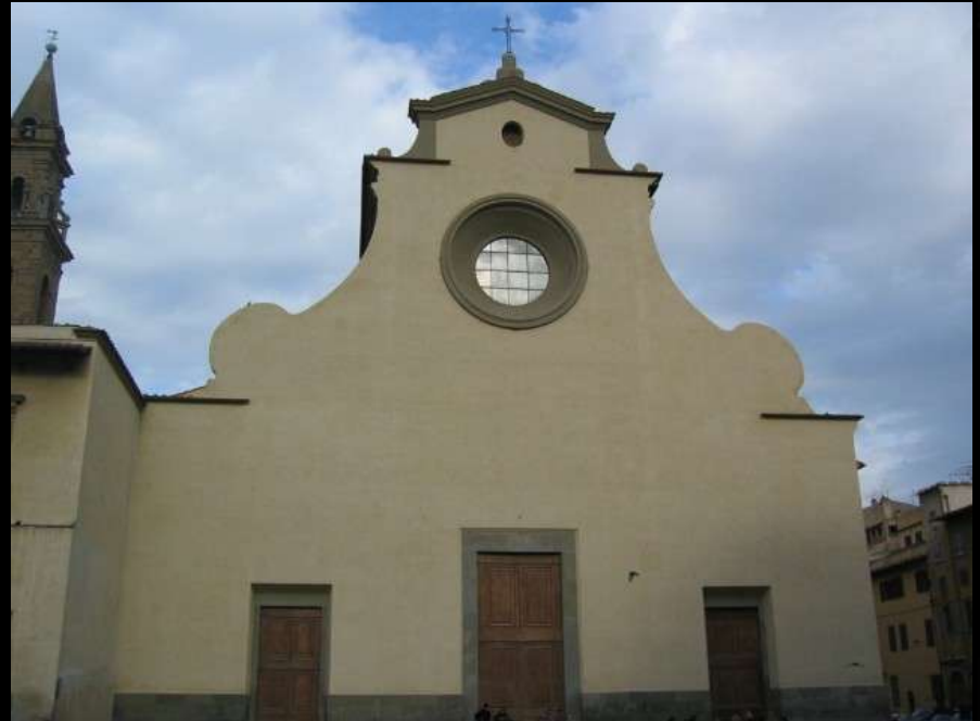
St. Spirito, Florence F. Brunelleschi, 1435