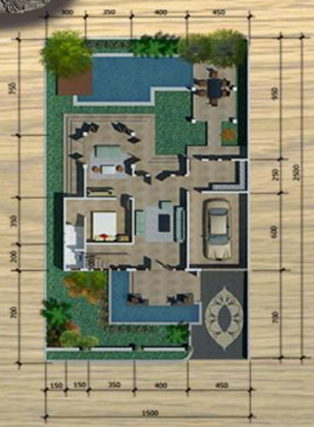
DENAH LT 1