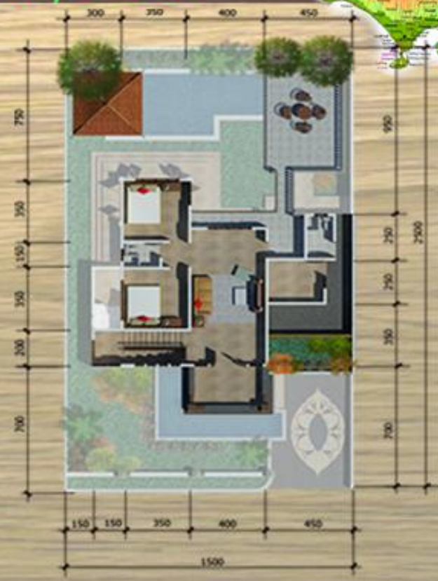
DENAH LT 2