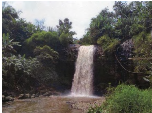
Gambar 2. Foto potensi sungai Cibeureum – Curug Sigay