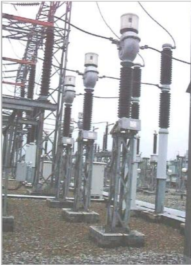
CT DAN LA 150 kV