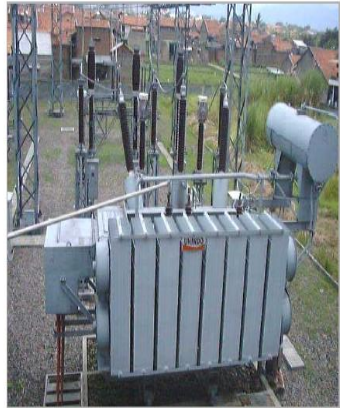
TRANSFORMATOR TENAGA 150/20 kV 30 MVA