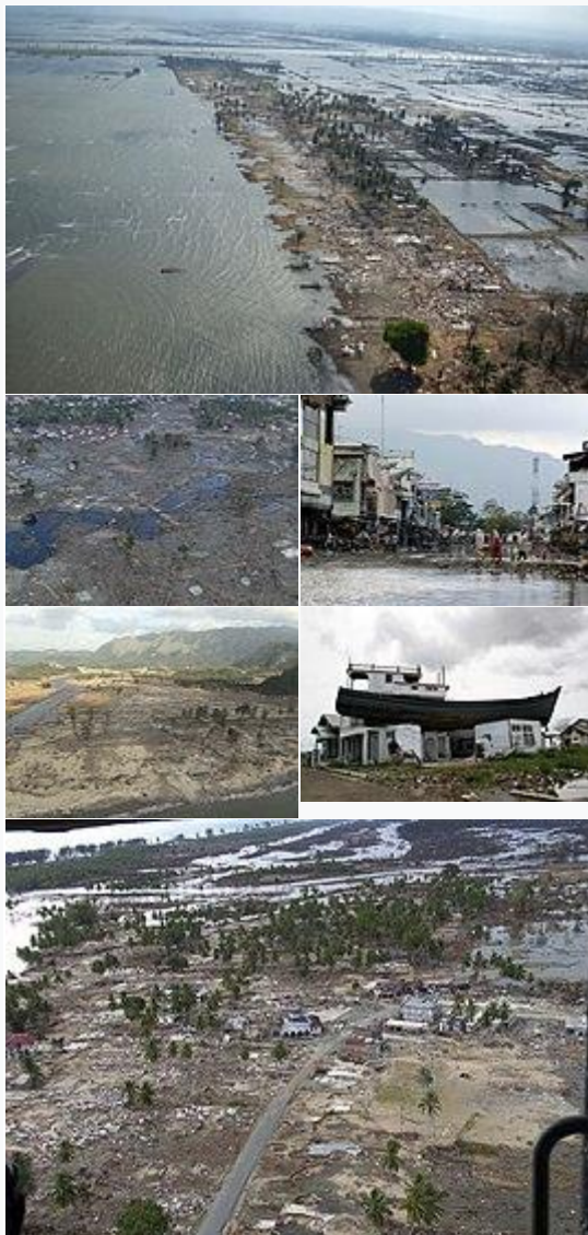
Aceh di Indonesia , daerah yang paling luluh lantah diterjang Tsunami dan Gempa bumi